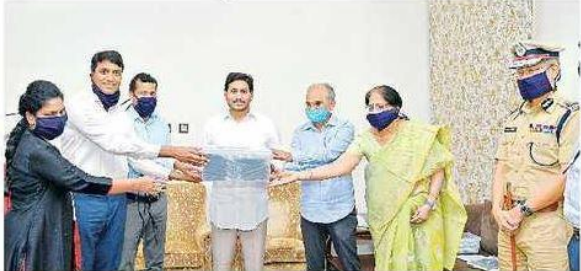
స్వయం సహాయక సంఘాల మహిళలు తయారుచేసిన మాస్కులను మెప్పా అధికారుల నుంచి అందుకుంటున్న ముఖ్యమంత్రి జగన్. వైద్య ఆరోగ్యశాఖ ప్రత్యేక ప్రధాన కార్యదర్శి జవహర్ రెడ్డి, సీఎం సీలం సాహెబ్, చిత్రంలో డిజిపీ గౌతమ్ సవాంగ్

ఈనాడు, ఈనాడు డిజిటల్, అమరావతి: కరోనా వ్యాధి నియంత్రణ చర్యల్లో భాగంగా ఇంటింటికీ పంపిణీ చేసేందుకు స్వయం సహాయక సంఘాల మహిళలు తయారుచేసిన మాస్కులను ముఖ్యమంత్రి జగన్ తాడేపల్లి నివాసంలో ఆదివారం అవిష్కరించారు. మెప్పా అధికారులు వీటిని సీఎంకు అందజేశారు. ప్రతి ఒక్కరికీ మూడేసి చొప్పున పంపిణీ చేసేందుకు మొత్తం 16 కోట్ల మాస్కులు అవసరం కాగా, ఆదివారం మధ్యాహ్నం వరకూ 7,28,201 మాస్కులు సిద్ధం చేసి రెడ్ జోన్లలో పంపిణీకి తరలించినట్లు అధికారులు సీఎంకు వివరించారు. నాలుగైదు రోజుల్లో రోజుకు 30 లక్షల చొప్పున సిద్ధం చేస్తామన్నారు. వీటి తయారీ, పంపిణీ సమాచారాన్ని ఎప్పటికప్పుడు ఆన్లైన్లో ఉంచుతున్నట్లు అధికారులు తెలిపారు. మాస్కుల తయారీని కాంట్రాక్టర్లకు కాకుండా స్వయం సహాయక సంఘాల మహిళలకు అప్పగించాం. 16 కోట్ల మాస్కుల తయారీకి 1.50 కోట్ల మీటర్లకు పైగా వస్త్రం అవసరం. ఇప్పటికే దాదాపు 20 లక్షల మీటర్ల వస్త్రాన్ని అమ్మో నుంచి సేకరించాం. మిగిలినది త్వరలోనే అందనుంది. స్వయం సహాయక సంఘాల అధ్యక్షులలో 40 వేల మంది దర్జీలతో యుద్ధప్రాతివదిక పని చేయనున్నాం. ఒక్కో మాస్కుకు దాదాపు రూ.3.50 చొప్పున ప్రతి మహిళకూ రోజుకు రూ.500కు పైగా ఆదాయం లభించేలా ఈ కార్యక్రమాన్ని రూపొందించారు. అధికారులు సీఎంకు వివరించారు. మాస్కుల పంపిణీని పోషకులకు నుంచి వారిలో దారి చేపట్టనున్నారు. వీటిని ఇంటి వద్దనే