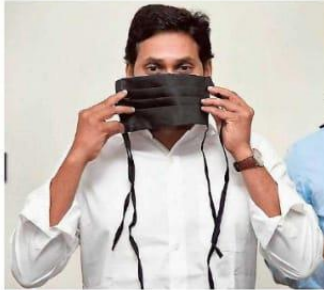
Safety message: Chief Minister Y.S. Jagan Mohan Reddy wearing a mask made by women of DWCRG groups, during a review meeting on COVID-19 on Sunday.

The CM further asked the officials to initiate steps to provide insurance to the ward / village volunteers, ASHA and sanitary workers.