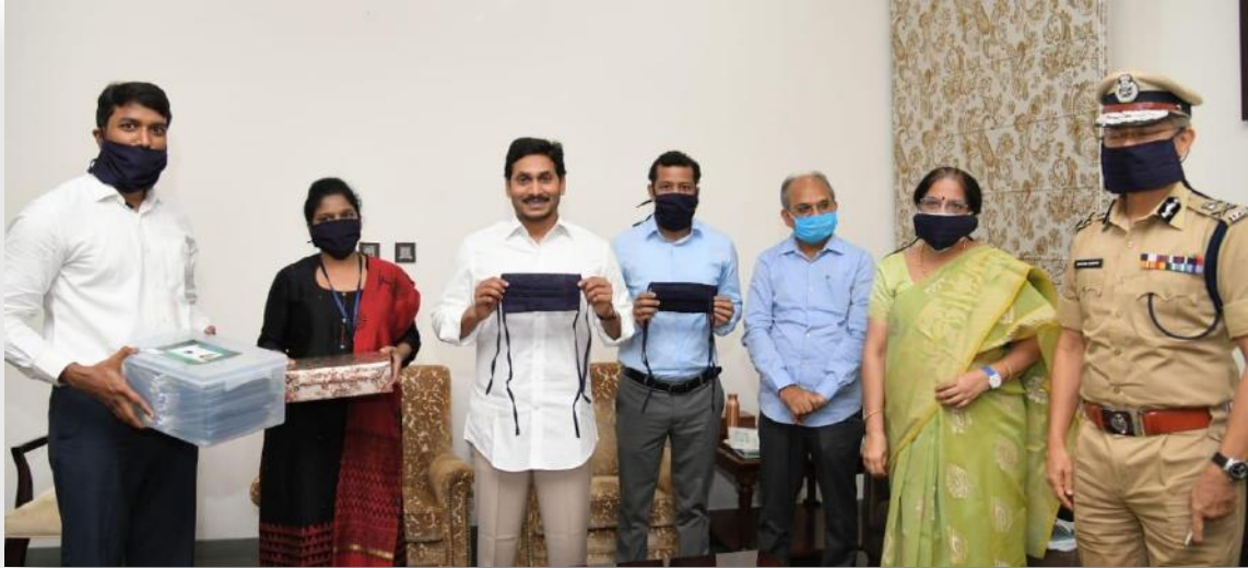
Hon'ble Chief Minister Sri YS Jaganmohan Reddy launched masks Distribution program at CM Camp office.